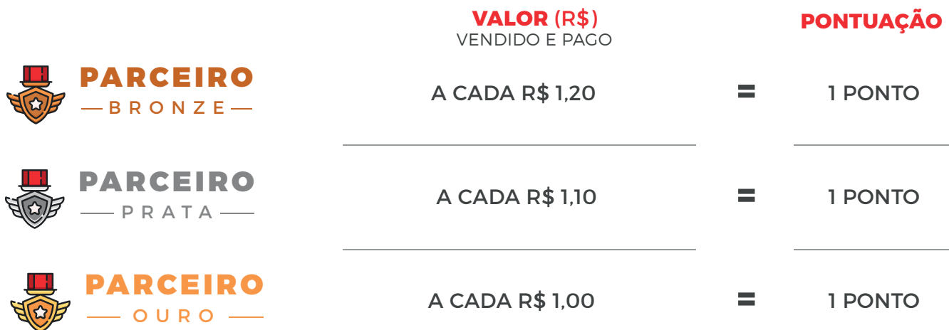
TABELA DE TROCA